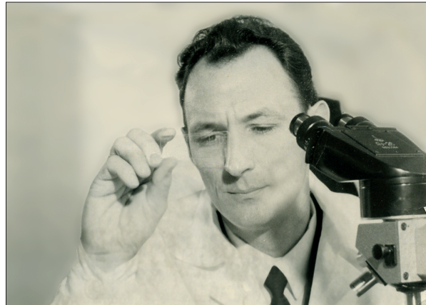
За роботою в лабораторії акарології. 1967 р.