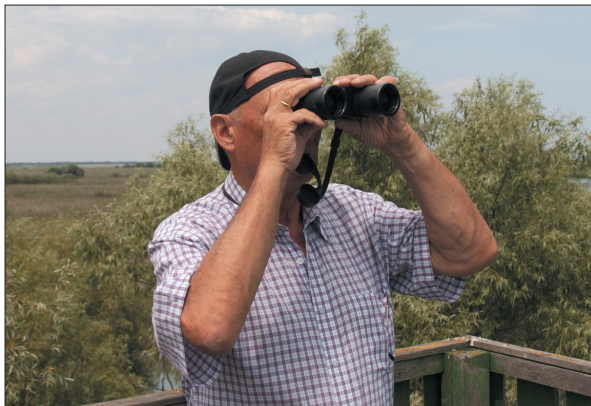
На кордоні, у заповіднику «Дунайські плавні». 2004 р.