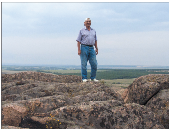
Заповідник «Кам'яні могили». 2005 р.

24 кандидатів наук, завдяки чому значною мірою було створено сучасну українську школу акарологів.