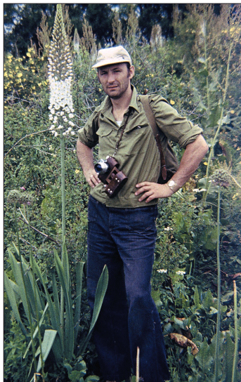
В країні еремурусів. Ак-Терек, Тянь-Шань (Киргизстан). 1977 р.