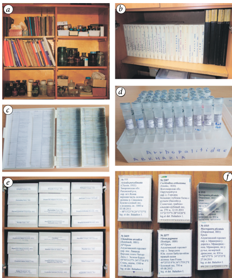
Рис. 1. Колекції відділу фауни та систематики безхребетних: a — шафа з колекцією веслоногих ракоподібних (Copepoda); b — загальний вигляд частини колекції печерних безхребетних (мікропрепарати колембол); c — постійні мікропрепарати деяких печерних безхребетних; d — приклад зберігання спиртового матеріалу Collembola; e — загальний вигляд колекції наземних молюсків, f — одиниці зберігання окремих видів наземних молюсків.