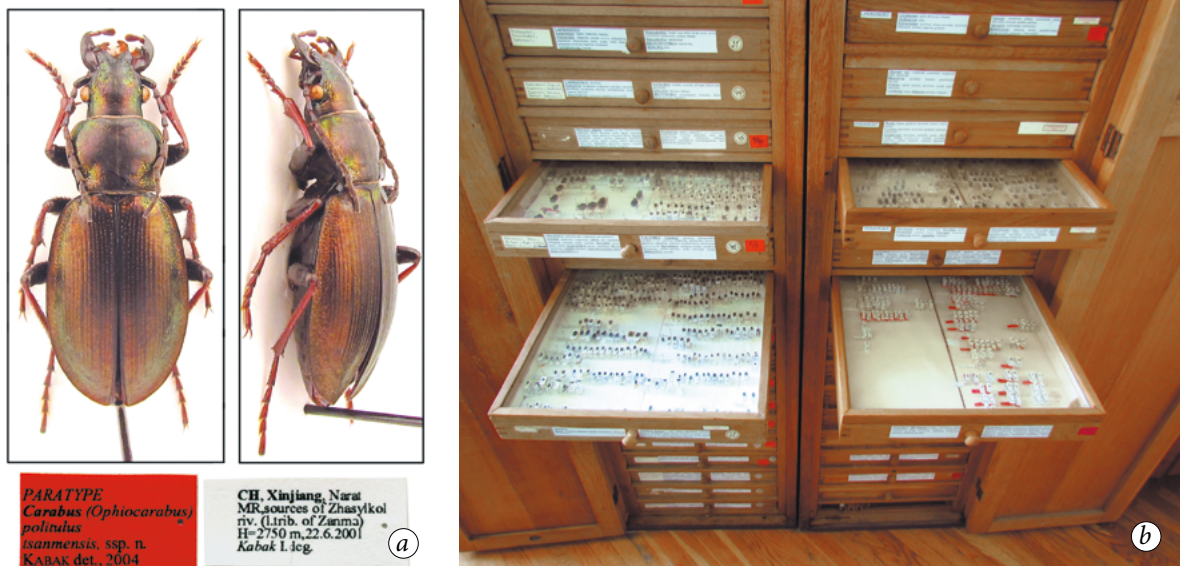
Рис. 3. Ентомологічні колекції ІЗШК (приклади): а — паратип самка Carabus (Ophiocarabus) politulus tsanmensis Kabak, 2004 (колекція О. В. Пучкова); б — загальний вигляд колекції жуків-стрибунів (Cicindelidae) та турунів (Carabidae) (О. В. Пучков).