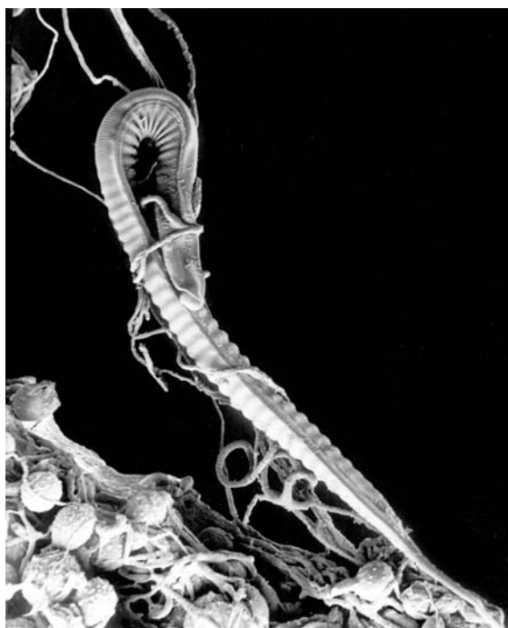
Рис. 1. Инвазионная личинка стронгилид, пойманная хищным грибом Duddingtonia flagrans (увеличение×600).